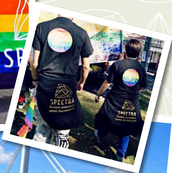
Spectra deltog tillsammans med tusentals färgglada studenter i Jönköpings Prideparad.