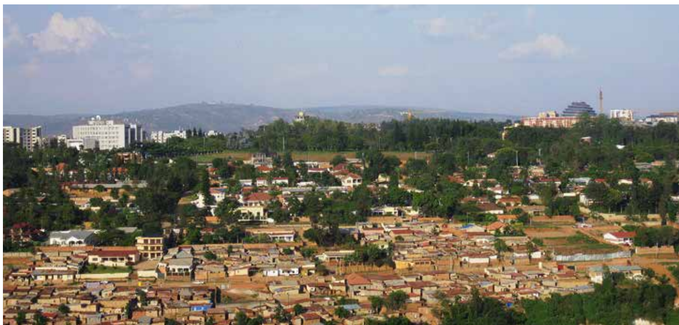
Vy över Kigali, Rwandas huvudstad.