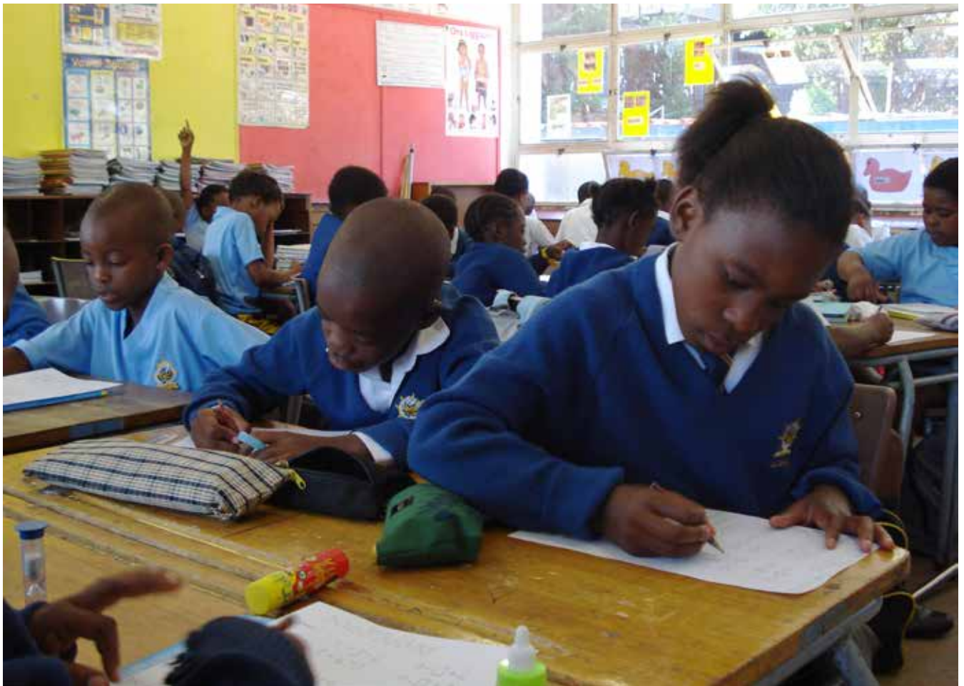
I Johannesburg studerar forskare matematikundervisningen bland barn i åldrarna 8–9 år.