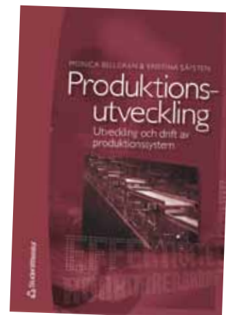
”Produktionsutveckling – utveckling och drift av produktionssystem”, 2005, Studentlitteratur.

– Ja, med internationella masterstudenter väcktes ett akut behov av att ha boken även på engelska, och den kommer att