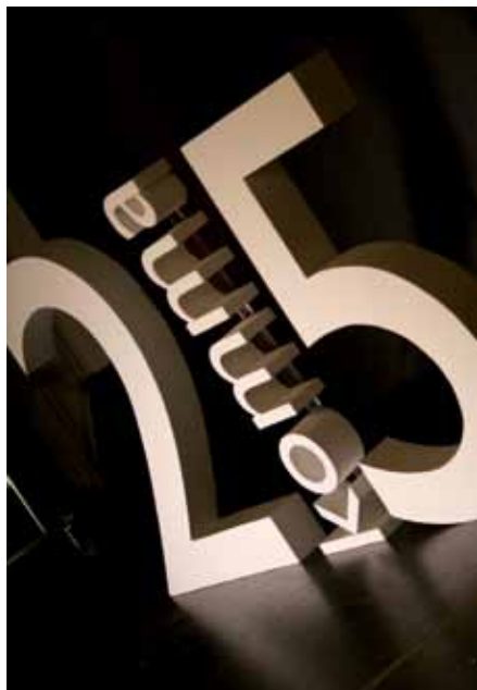
2komma5 – varje avslutad kurs förser läraren med 2,5 högskolepoäng i sitt CV.

– Verksamma lärare köper en kurs hos oss och har sedan två år på sig att slutföra den. Slutför man den på en vecka har man ändå tillgång till materialet under två års tid.